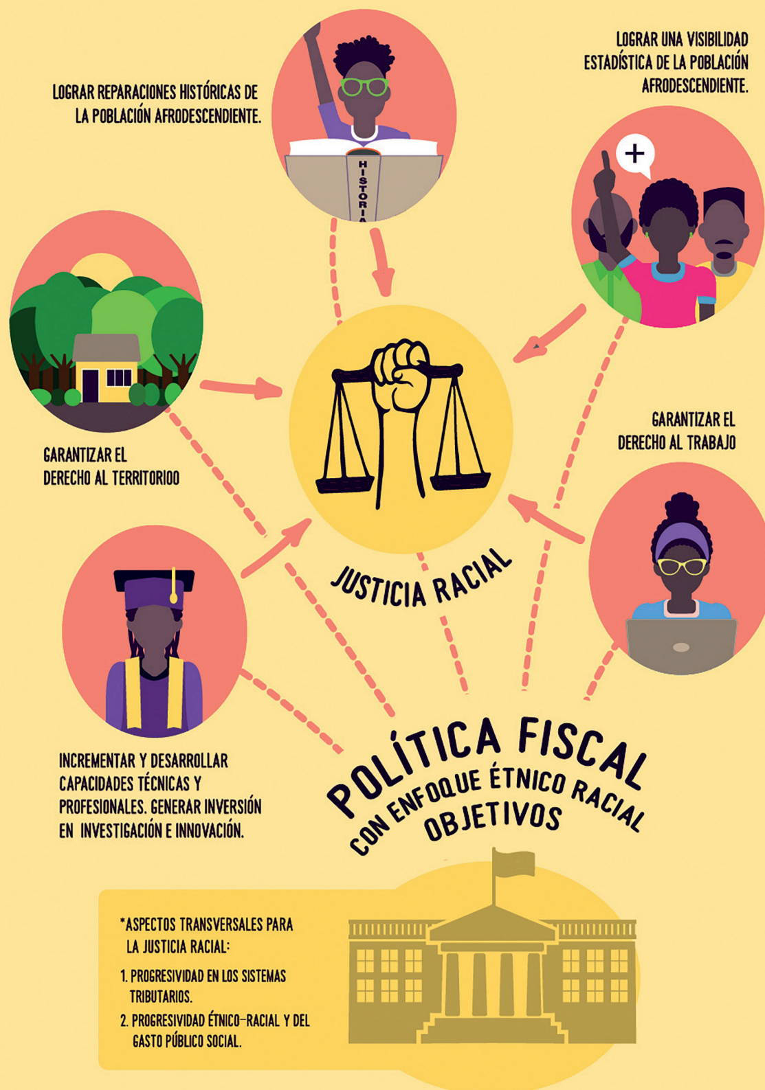
Ilustración 2. Política fiscal con enfoque étnico-racial